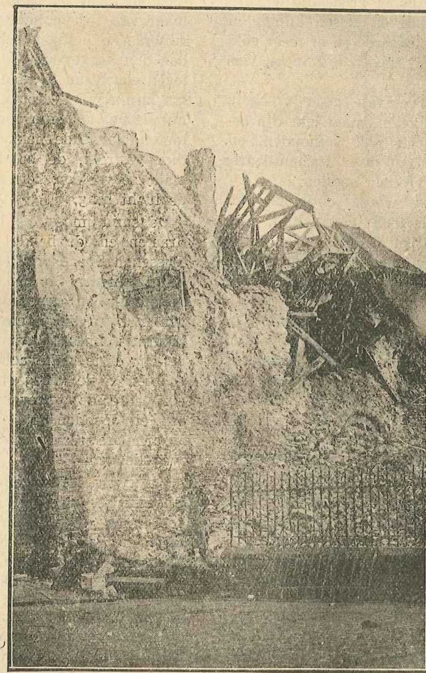
De kerk van Torhout, zooals de Duitschers in Oktober 1918 haar achterlieten

En 's Maandags reden de kurassiers op Torhout aan. Veel menschen zaten