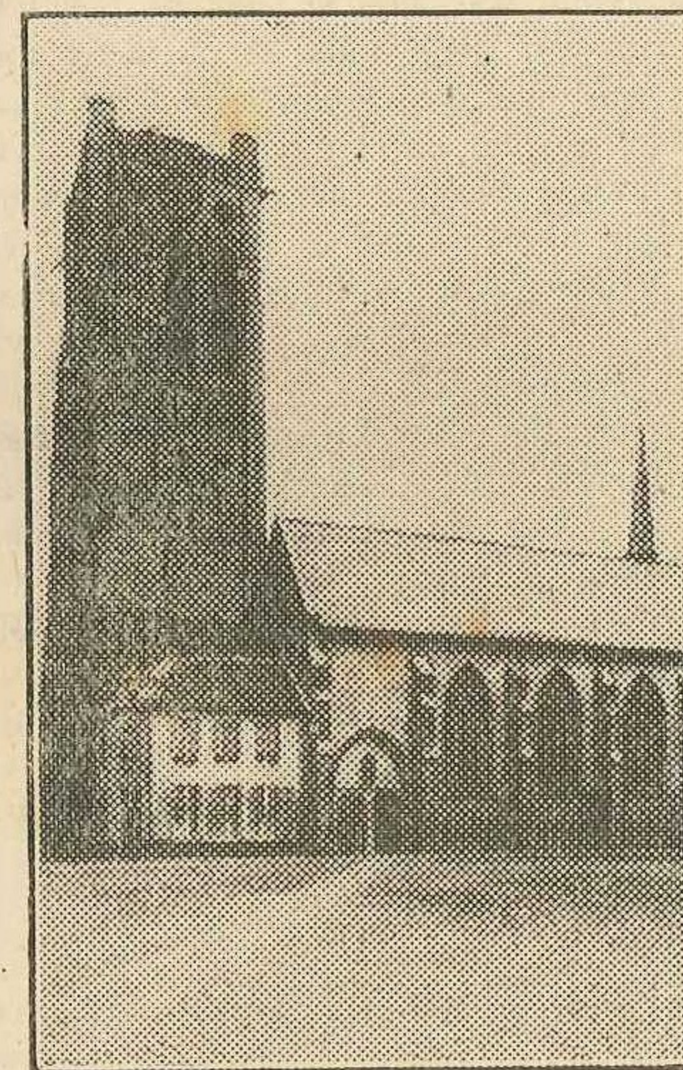
De Sint-Nikolaaskerk te Veurne

Het slot bezat dus een kapel, verder een ruime keuken, een wapenzaal, een